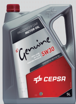
Gama Moto, Genuine y Avant: plata

de Cepsa, permitiendo el reconocimiento rápido del producto por el usuario y su diferenciación con el resto de fabricantes.